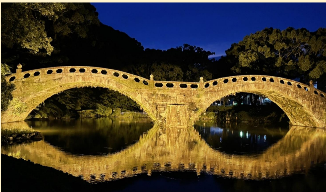
▼諫早公園眼鏡橋オレンジライトアップ