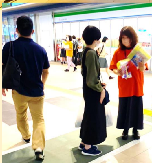
◀諫早駅構内にて チラシ配布