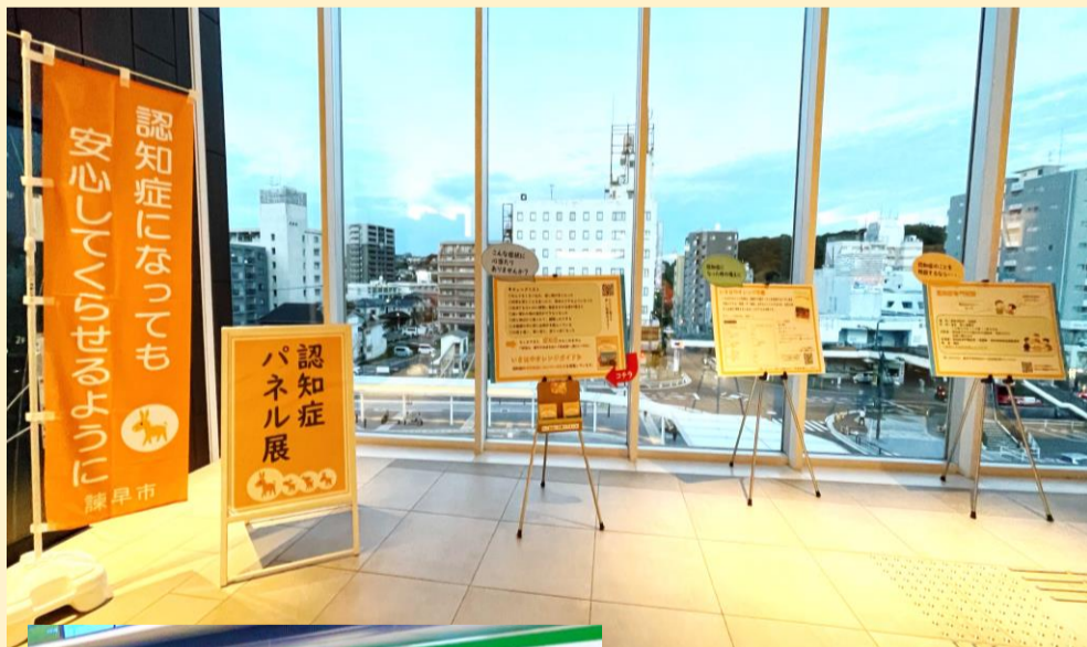
◀諫早駅構内認知症パネル展