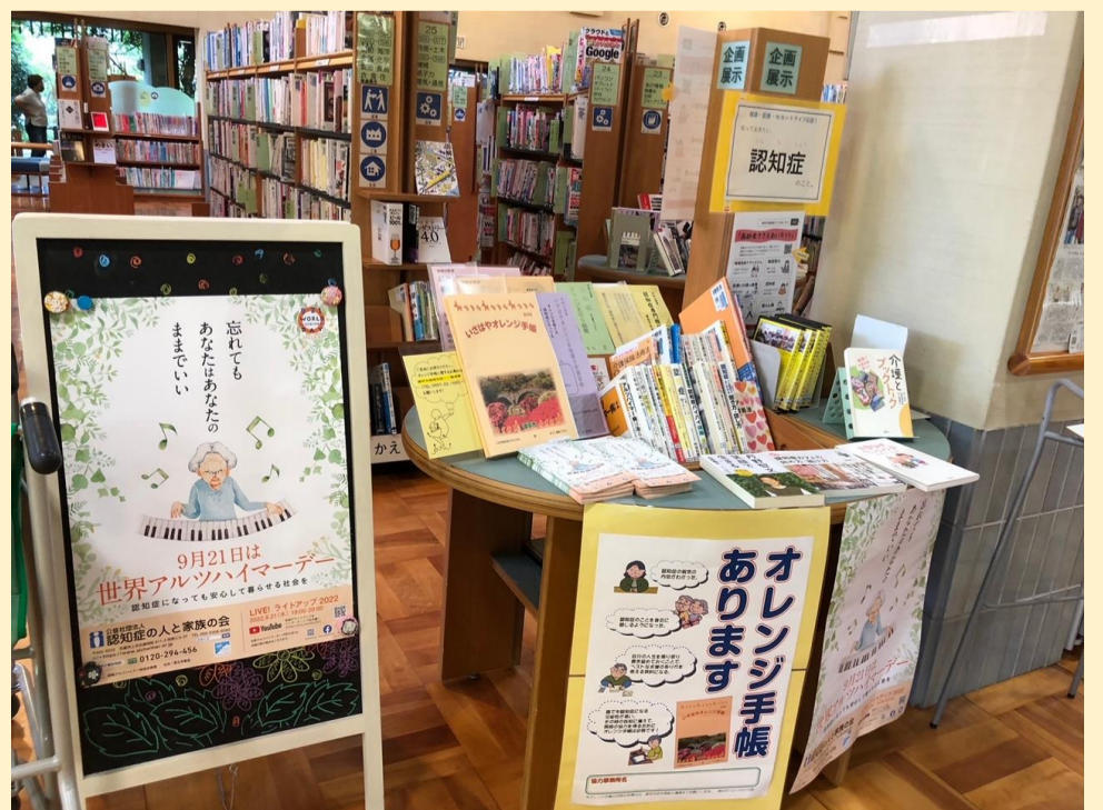
▼市内図書館認知症特設コーナー